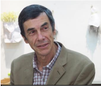
グロッセ・リュック (パザリスト/ピカデナー) 自然を活かした庭づくり

エコールグロッセは…“みどりのゆび”を育てる自然の学校。自然から学び、自己を開花させる表現と創造の学び場 自然界をよく観察していると、あらゆるレベルに振動とリズムの形跡が刻まれています。葉っぱの周りのギザギザは、その葉っぱ固有の符号とリズムそのもの。芸術と自然科学と哲学の融合のように様々な流れを統一し、融合させる時代が来たのではないかとされます