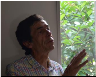
グロッセ・リュック (パザリスト/ピカデナ) 自然を活かした庭づくり

エコールグロッセは…“みどりのゆび”を育てる自然の学校。自然から学び、自己を開花させる表現と創造の学び場 自然界をよく観察していると、あらゆるレベルに振動とリズムの形跡が刻まれています。葉っぱの周りのギザギザは、その葉っぱ固有の符号とリズムそのもの。芸術と自然科学と哲学の融合のように様々な流れを統一し、融合させる時代が来たのではないかとされます