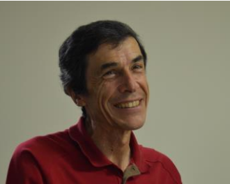
グロッセ・リュック (パザリスト/ピカデナ) 自然を活かした庭づくり

エコールグロッセは…“みどりのゆび”を育てる自然の学校。自然から学び、自己を開花させる表現と創造の学び場 自然界をよく観察していると、あらゆるレベルに振動とリズムの形跡が刻まれています。葉っぱの周りのギザギザは、その葉っぱ固有の符号とリズムそのもの。芸術と自然科学と哲学の融合のように様々な流れを統一し、融合させる時代が来たのではないかとされます